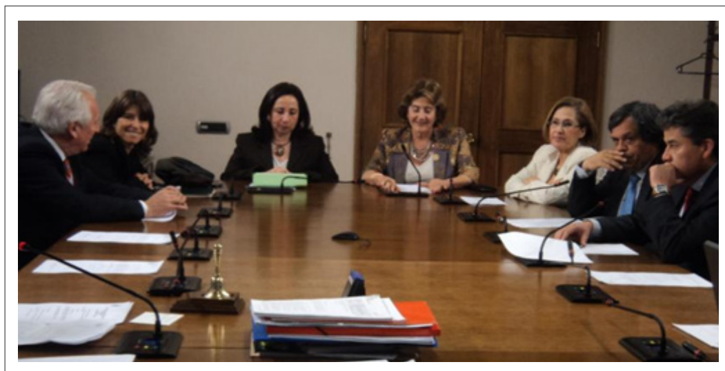
Constitución de la Comisión de Recursos Hídricos, Desertificación y Sequía

La constitución oficial de la nueva comisión se realizó el 17 de octubre de 2012, ocasión donde se procedió a elegir como presidenta a la diputada Adriana Muñoz, quien fuera autora de la Moción para la constitución de la nueva Comisión Permanente.