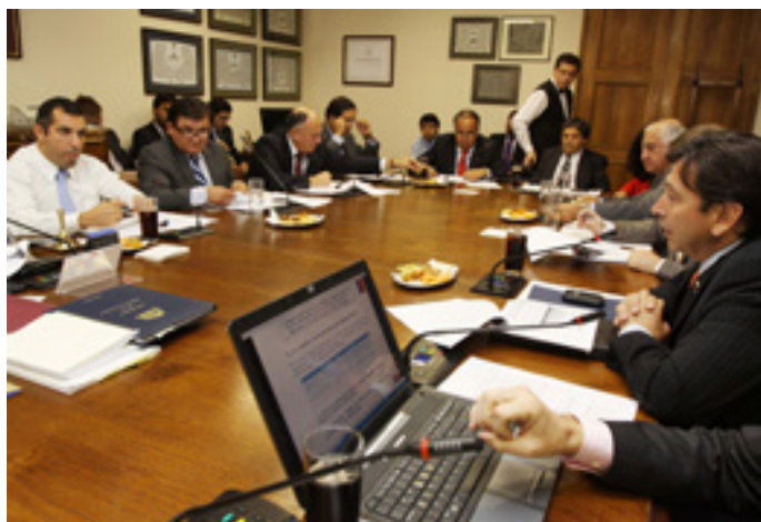
Comisión Obras Públicas – Cámara de Diputados

En la primera sesión , el Ministro de Obras Públicas, Laurence Golborne presentó ante la comisión el proyecto de ley, destacando que los principales puntos que el mensaje pretende resolver son aumentar las multas y sanciones por delitos en materia de agua, con el fin de establecer un mecanismo realmente disuasivo en esta materia, y aumentar las herramientas de la Dirección General de Agua, tanto en el manejo de información de los derechos, como en materia de fiscalización. Terminada la presentación del Ministro, la comisión decidió realizar audiencias para profundizar sobre el tema.