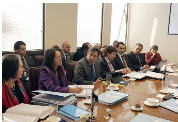
Comisión Obras Públicas – Senado

En la segunda sesión , el proyecto fue aprobado en general por unanimidad por los parlamentarios presentes: Senador Sabag (PDC), Senador García-Huidobro (UDI), Senador Horvath (RN) y Senador Quintana (PPD). Posterior a esta votación, la discusión del proyecto de ley se encuentra detenida.